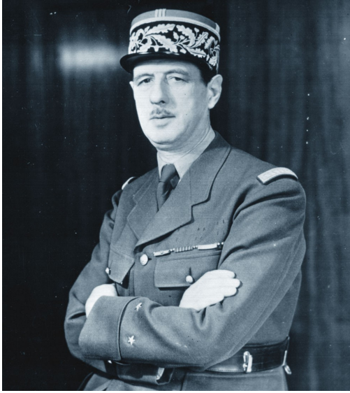
1 Le général de Gaulle en 1942