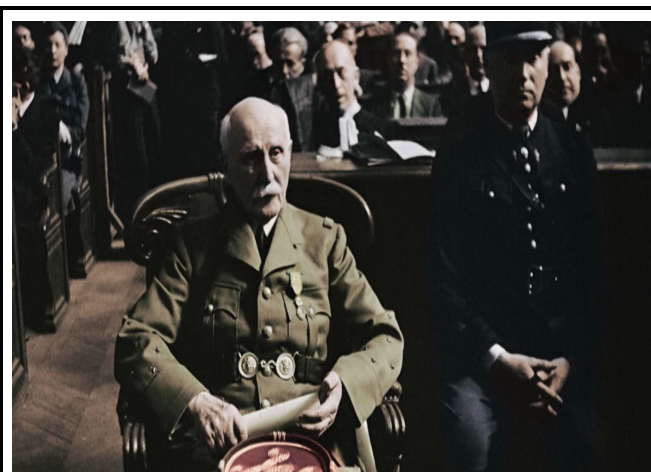
17 Pétain jugé et condamné en 1946 par la justice Française