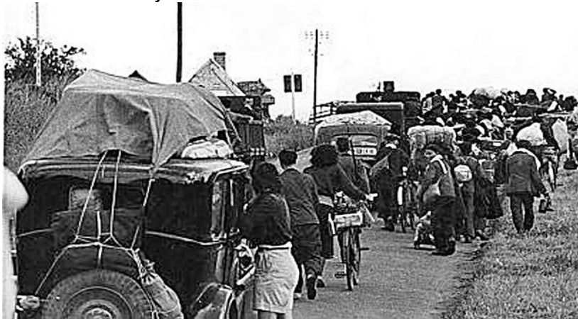
5 Des Français.e.s sur la route de l'exode en 1940