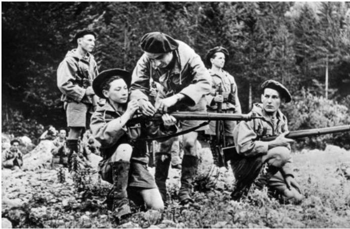
7 Des résistants dans le Vercors en 1943