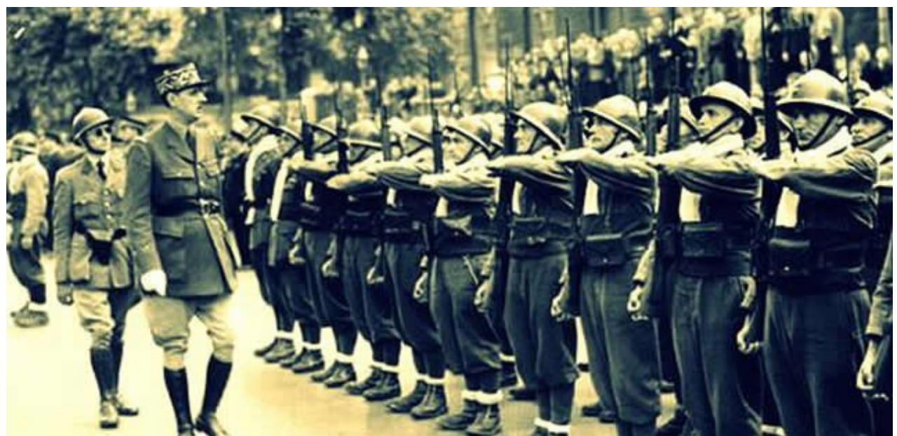
14 De Gaulle passant en revue des soldats de la France Libre