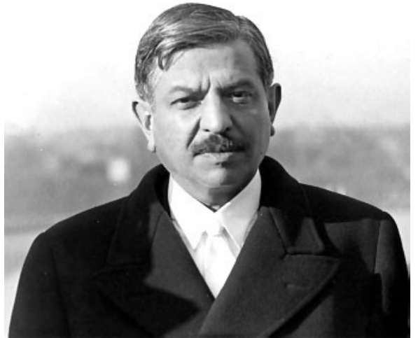
Pierre Laval en 1940