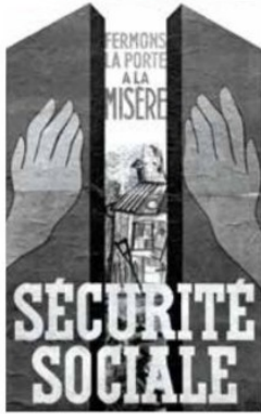
▲ Affiche, 1945.

Financée par les cotisations des employeurs et des salariés, la Sécurité sociale est un système de redistribution.