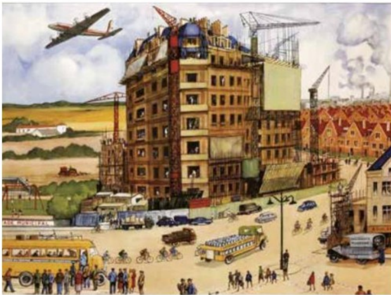
◀ Affiche scolaire, « Les Français se sont remis au travail », éditions Rossignol, 1953.

Ce panneau, destiné à être affiché dans les écoles, diffuse les images de la reconstruction du pays. Les grands chantiers de la reconstruction sont dirigés par le commissariat au Plan. L'aide américaine du plan Marshall et l'appel à une main-d'œuvre immigrée permettent la reconstruction. Les dirigeants de la IV e République souhaitent forger une France nouvelle, dotée d'une économie moderne. Ils font entrer la France dans une longue période de croissance économique.