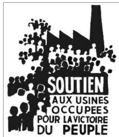
Affiches produites par l'Atelier populaire de l'École des Beaux Arts de Paris (mai 1968)