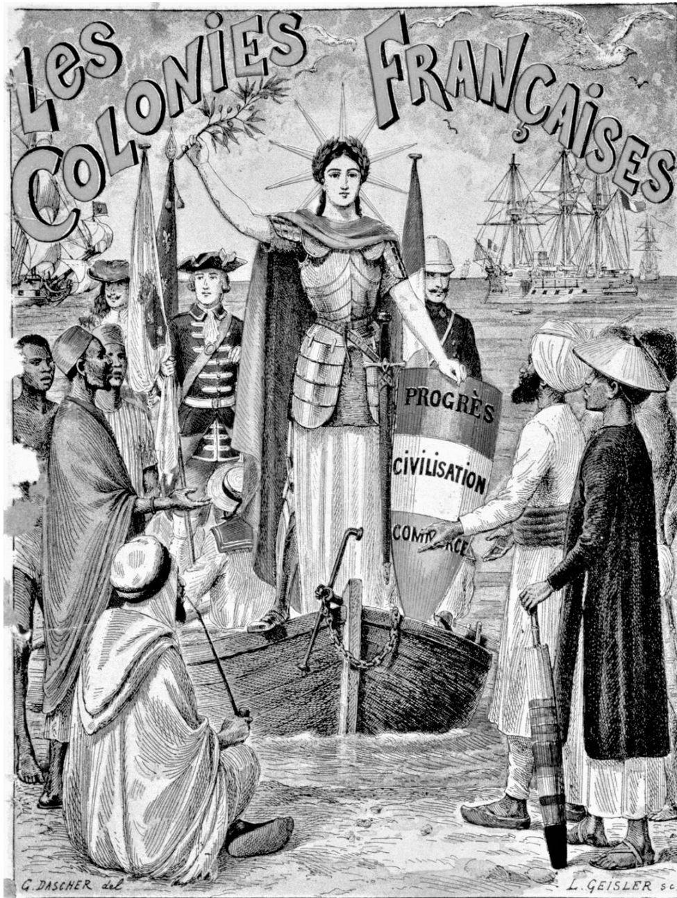
Couverture d'un cahier scolaire, vers 1900