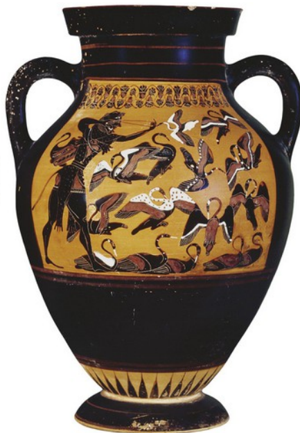
▲ Amphore, VI e siècle av. J.-C. (British Museum, Londres).

Le 2 e des douze travaux : Héraclès tue l'hydre de Lerne, un monstre à neuf têtes.