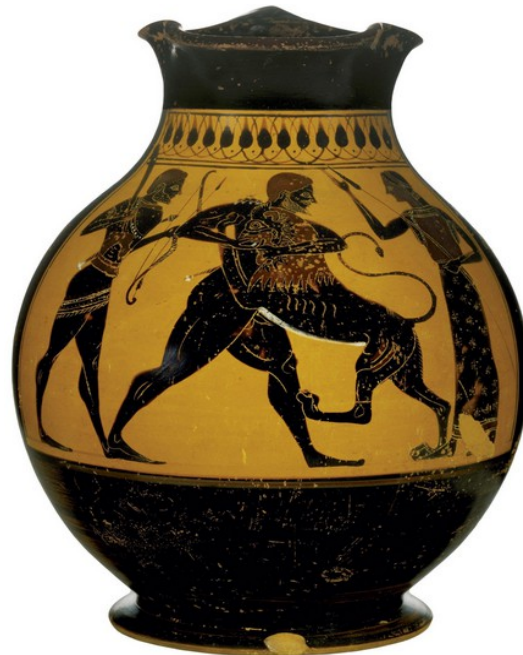
▲ Cœnochoé, VI e ou V e siècle av. J.-C. (musée du Louvre, Paris).

Le 6 e des douze travaux : Héraclès effraie les oiseaux du lac Stymphale, qui dévorent les hommes.