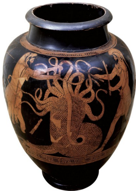
▲ Stamnos, vers 480 av. J.-C. (musée de Palerme).

Beaucoup de témoignages de l'époque des cités grecques nous est fourni par les vases grecs. On peut y retrouver des témoignages de la vie quotidienne mais aussi des récits de mythes et de héros. A partir de trois exemples, voyons comment les Grecs mettent en scène leur mythologie.