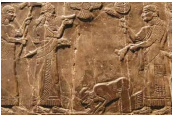
▲ Obélisque noir de Nimroud-Kalath, IX e siècle avant J.-C. (British Museum, Londres).

Le roi d'Israël, Jéhu (840-814 avant J.-C.), se prosterne et paie un impôt au puissant roi assyrien.