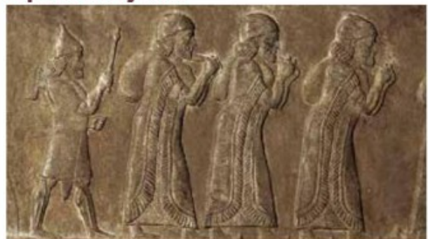
▲ Bas-relief, palais assyrien de Nimrud, 730-727 avant J.-C. (British Museum, Londres).

Le roi d'Israël, Jéhu (840-814 avant J.-C.), se prosterne et paie un impôt au puissant roi assyrien.