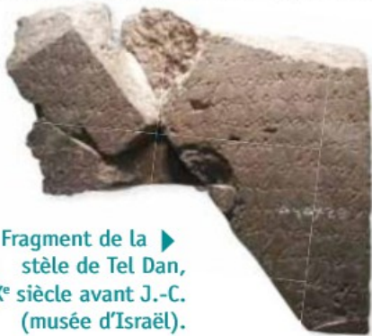
Fragment de la ► stèle de Tel Dan, IX e siècle avant J.-C. (musée d'Israël).

La stèle, élevée probablement au IX e siècle avant J.-C., est le premier texte à mentionner l'existence d'un roi fondateur appelé David.