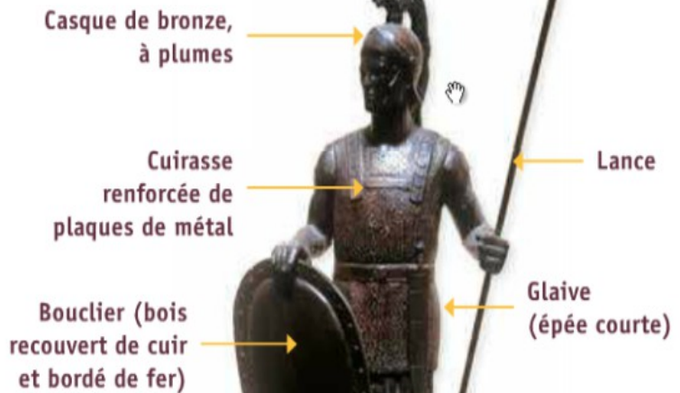
Statuette en bronze, ► II e siècle avant J.-C. (musée de la Civilisation romaine, Rome).

À la fin de la République, l'armée romaine est constituée de légionnaires, tous citoyens romains. Les conquêtes sont de plus en plus nombreuses et l'armée se transforme : des soldats sont recrutés parmi les populations soumises.