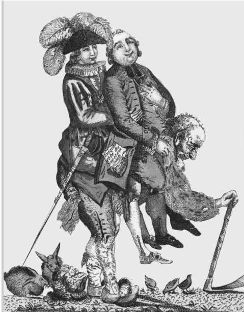
Les ordres privilégiés : un fardeau pour le tiers état

Consigne: Observez le document puis répondez aux questions à l'aide de phrases.